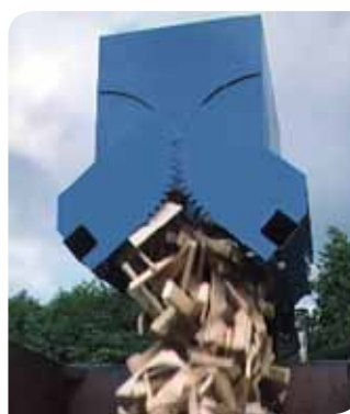
Sesam gir bedre arbeidsforhold innenfor helse, miljø og sikkerhet.